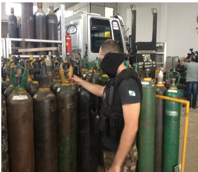
Segundo as investigações, cilindros industriais eram vendidos como se fossem medicinais

Ainda de acordo com o Gaeco, há cerca de outras dez empresas que estão sendo investigadas.